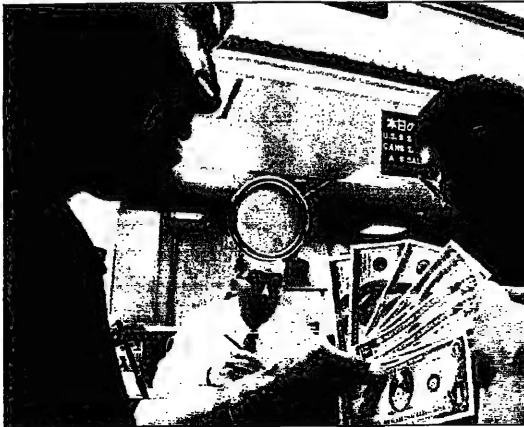
دول اسمايل ياباني يمتص مبيعاتها الفدادات التي تشتد من مركز صرف في سطر طوكيو بسعر الين من ما كان سابقا قبل اليا (مفتحة)